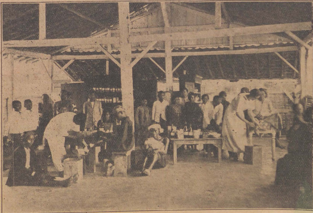
IN DE GOEDE HANDEN VAN DEN „BARMHARTIGEN SAMARITAAN”.